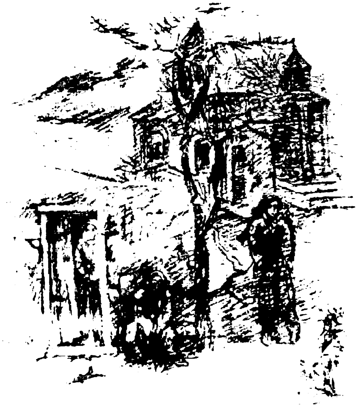
Հալիպան գյուղ 1974 Армянская деревня.