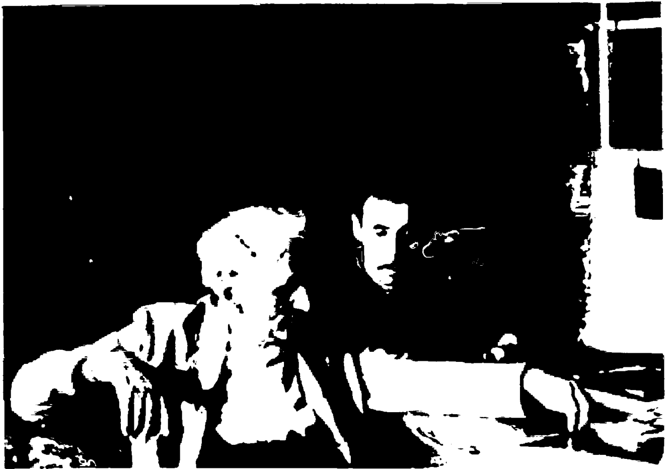
У. Ушржибн Аби С. М. Серьяном