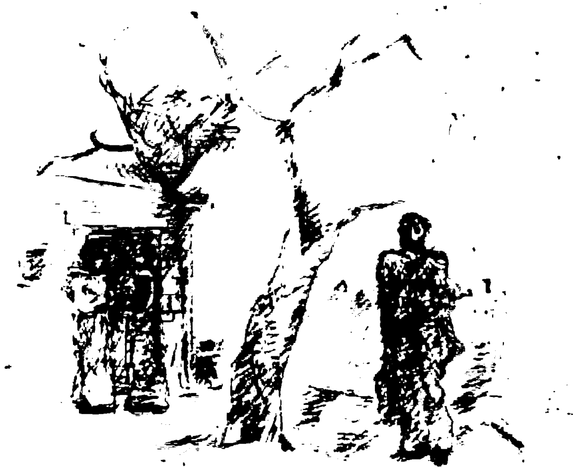
Эшфррд. 1974 Пугник.

посвященных родной деревне, в том числе серия рисунков с изображением матери, проникнута неподдельной любовью и грустью.